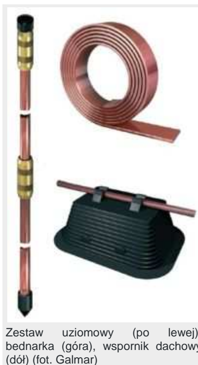
Zestaw uziomowy (po lewej), bednarka (góra), wspornik dachowy (dół)

Zwody powinny przebiegać przez wszystkie elementy wystające ponad powierzchnię dachu (kominy, wyloty przewodów wentylacyjnych itp.) i być połączone z takimi elementami jak maszty antenowy.