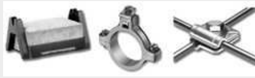
Sposób umocowania zwodów na dachu (fot. Uchwyty do mocowania zwodów: (od lewej) betonowy, zacisk, Cerabud) uchwyt krzyżowy

Zwody naturalne to połączone z instalacją odgromową takie elementy metalowe jak balustrady, poręcze czy rynny, przez które energia elektryczna uderzenia pioruna jest odprowadzana do ziemi.